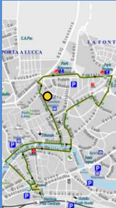
linea LAM Verde